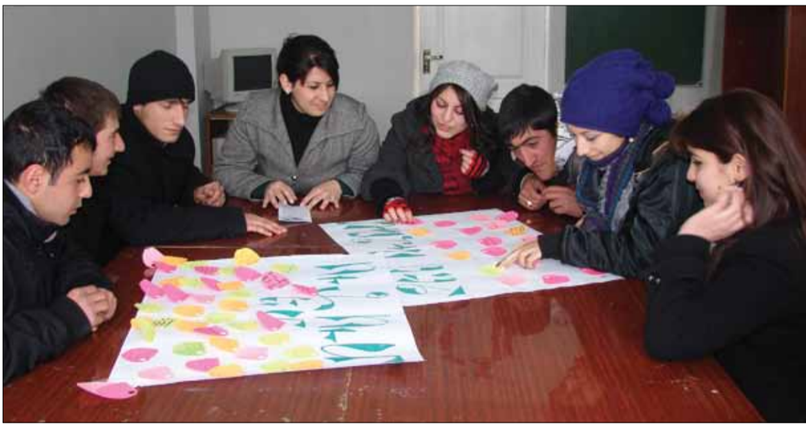
ՀԴՃՀ Կապանի մասնաճյուղի ուսխորհուրդը աշխատանքային հերթական ծրագիրը քննարկելիս:

– Դասախոս աշխատելու համար հաշվի ենք առնում մախ մասնագիտական կրթությունը (բակալավրիատ, մագիստրատուրա, ասպիրանտուրա), ինչպես եւ գիտական աստիճանը, դասախոսական աշխատանքի փորձը, կարողությունները, մանկավարժական հմտությունները: Իմ պաշտոնավարման առաջին տարում 125 ուսանող ունեցեք, 11 դասախոս, որոնցից միայն երկուսն ուներ գիտական աստիճան: Այսօր ունենք գիտության 10 թեկնածու եւ դոկտոր: Տնտեսագիտական մասնագիտության գծով գիտության թեկնա-