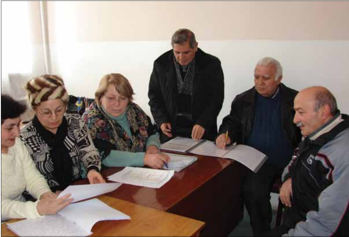
Ընդերքաբանության և մեթալուրգիայի ամբիոնի հերթական նիստը: